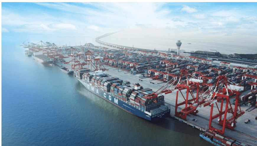
图 1 港口自动化码头

每台轨道吊内部采用单独的 PLC 控制系统进行控制，每台轨道吊内部通过部署 20 套高清摄像机实时远程监控轨道吊运行状态和周边实时画面，借助于该系统采集各项实时画面并同步传送至自动化操作中心的 4 台远程操作台。轨道吊区域和自动化操作中心之间存在一个汇聚电气机房，作为轨道吊的现场汇聚节点将信息集中传输至自动化主操作中心。项目布置示意如图 2 所示：