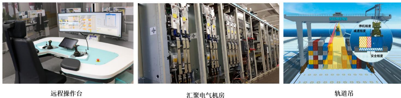
图 3 现场设施示意图